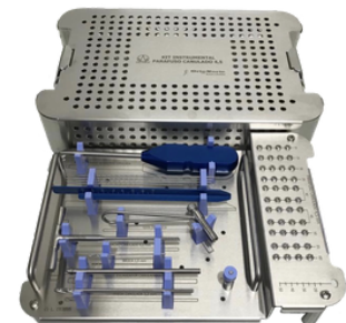
Instrumental Parafuso Canulado 4,5 Aço Inoxidável ANVISA 80062909002