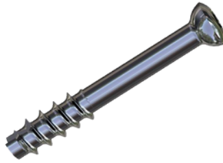
Parafuso Canulado 4,5mm ANVISA 80062900012